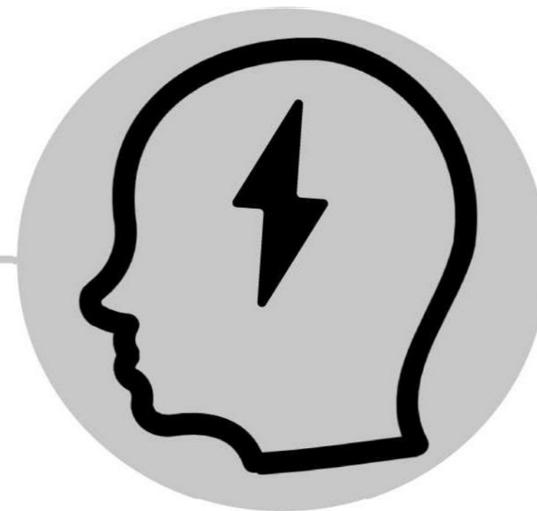
آلام الرأس والجسم